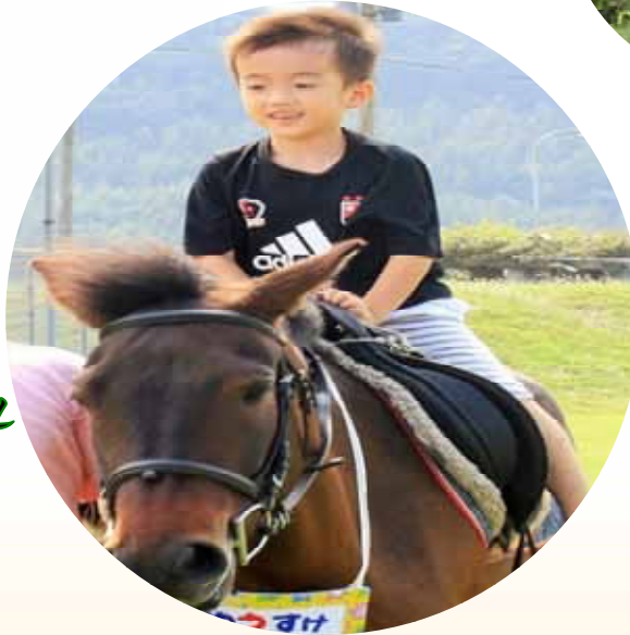
9月 動物愛護 フェスティバル