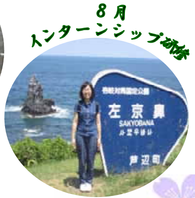
8月 インターンシップ研修