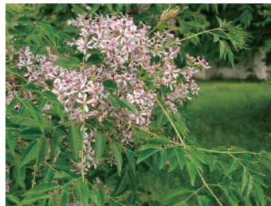
センダン (嘔吐、 神経症状、 死亡)