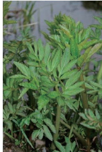
ドクゼリ (神経症状、死亡)