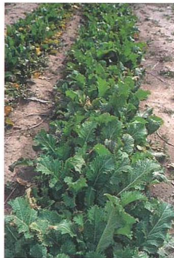
セイヨウカラシナ (溶血性貧血)