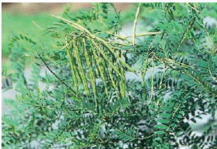
クララ (呼吸速拍、痙攣)