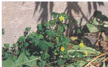
カタバミ (神経症状)