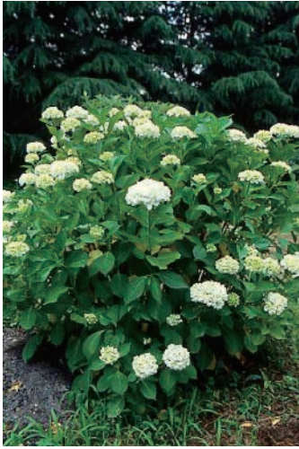
アジサイ (下痢、痙攣)