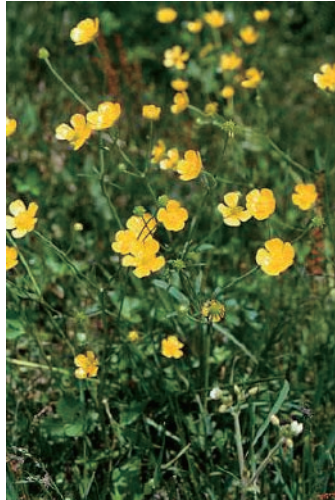
ウマノアシガタ (疝痛、嘔吐、死亡)