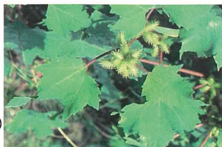
オナモミ種子 (起立困難、 神経症状、 死亡)