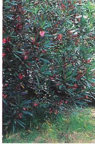
キョウチクトウ (下痢、呼吸困難)