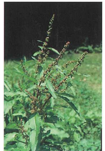
ギシギシ (尿管閉塞)