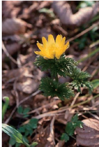
フクジュソウ (嘔吐、痙攣、呼吸困難)