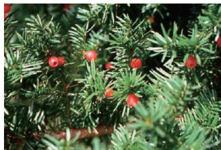
イチイ (食欲廃絶、 反芻停止)