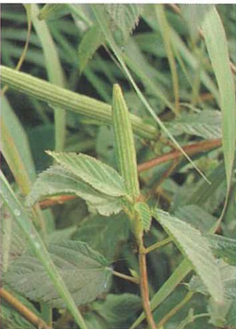
モロヘイヤ種子 (死亡)