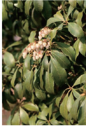
アセビ (知覚過敏、全身麻痺)