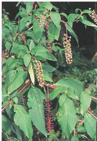
ヨウシュヤマゴボウ (嘔吐、下痢、痙攣、死亡)