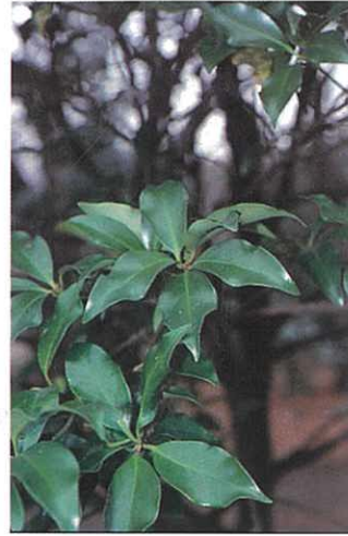
シキミ (ハナシバ) (神経症状、死亡)