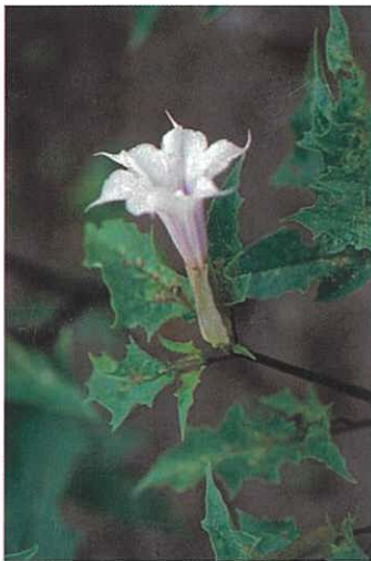
チョウセンアサガオ (唾液分泌、胃運動低下)