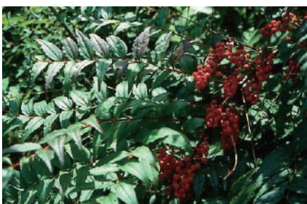
ドクウツギ (神経症状、 死亡)