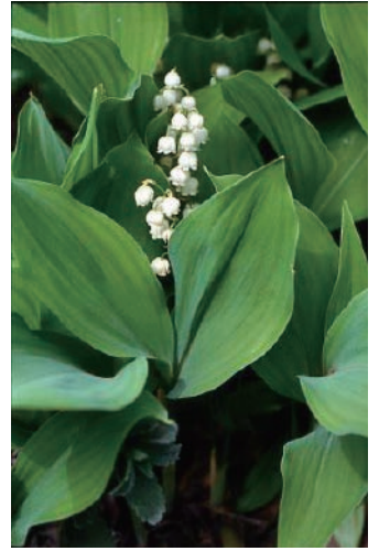
スズラン (嘔吐、下痢、痙攣)