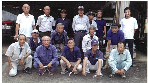
農事組合法人 岳辺田