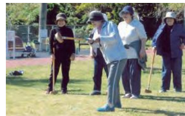
活動の様子(岬ふれあおう会)