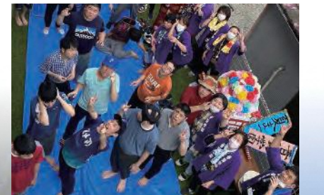
園内で開催されるイベント「納涼祭」

利用者に良い支援を行うためには、職員が誇りを持って働ける環境づくりが大切です。職場の雰囲気や各種制度を整えながら、笑顔で働けるように努めており、職員には「日本一の施設を目指していこう」と言っています。「日本一の施設」の定義は、利用者とその家族にとってかけがえのない「希望の施設」ということです。障害があっても、普賢学園なら自分らしく暮せると希望を感じていただき、さまざまなニーズに応え、自立に向け総合的なサポートができる施設を目指しています。