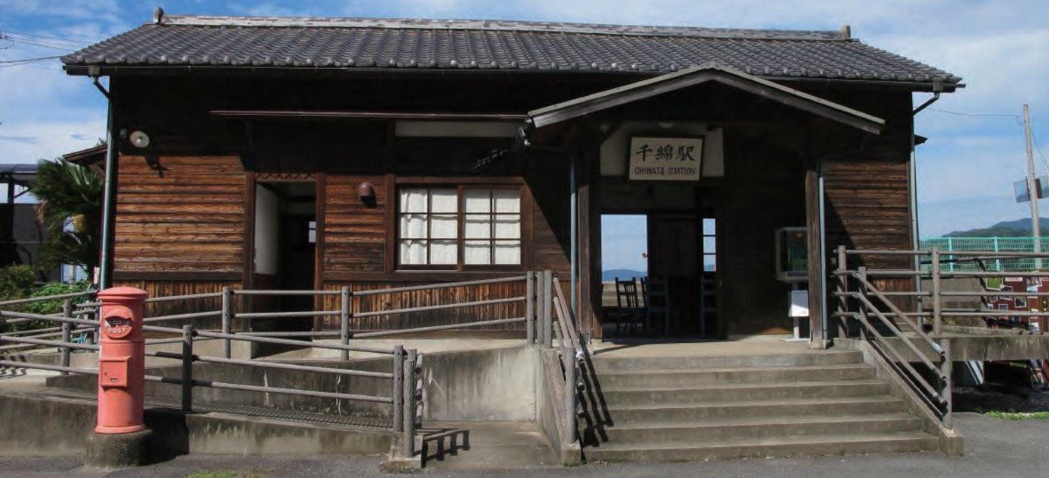
昭和の面影を残す木造駅舎が人気の千綿駅