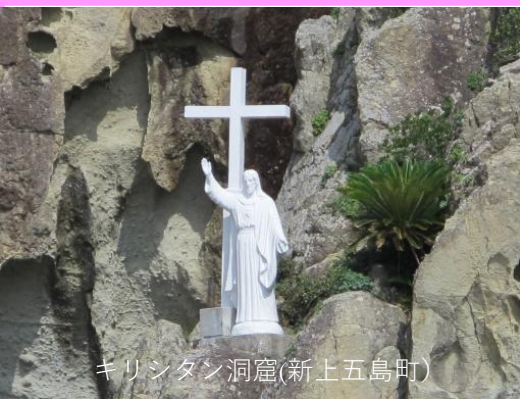
キリシタン洞窟(新上五島町)