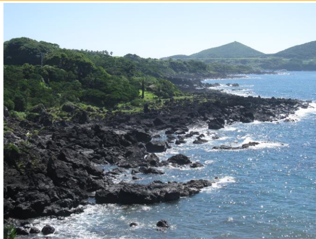
鑑瀬（あぶんぜ）溶岩海岸（日本ジオパーク）

今年の夏には、ジオパークの醍醐味を感じられる鑑瀬（あぶんぜ）地区にラグジュアリーホテルが開業予定ですので、皆様、今後も五島列島にご注目ください。