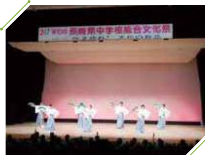
昨年度の県中総文祭の様子

期日 12月1日(木)～2日(金) 会場 長崎ブリックホール 内容 舞台発表12月2日(金) 展示発表12月1日(木)、2日(金) 長崎県内の中学生が、音楽や伝統芸能、演劇、意見発表、授業等で制作した作品の展示などの発表を行います。