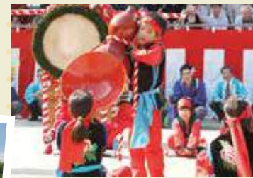
▲▼中尾獅子浮立と唐子踊