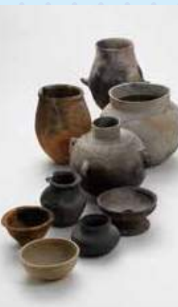
原の辻遺跡から出土した大陸・半島系土器

吉岐市にある国指定特別史跡の原の辻遺跡から出土した中国大陸や朝鮮半島系の遺物を分析したところ、交流の歴史について新たなことがわかってきました。昨年度友好機関協定を締結した韓国釜山博物館の研究結果と照らし合わせて、当時の東アジア国際文化交流の様子を明らかにするシンポジウムを開催します。