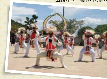
田結浮立 掛け打ち踊り