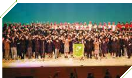
昨年度の県高総文祭の様子

期日 11月11日(金)～13日(日) 会場 アルカスSASEBO、佐世保市体育文化館 内容 県高等学校文化連盟の加盟校の代表生徒が一同に会し、演奏や演技、展示などの発表を行います。11日(金)は総合開会式、12日(土)と13日(日)は県高文連各専門部による部門発表です。