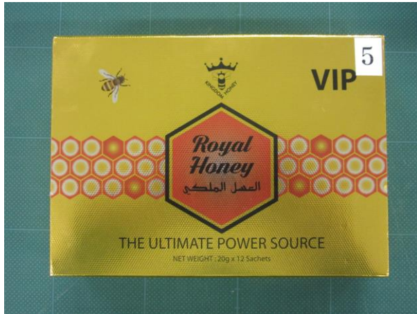
Royal Honey VIP