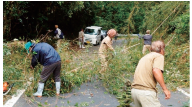
道路周辺の美化活動＝令和2年10月、五島市内

市では令和2年から、協議会関係者を集めて それぞれが活動内容を発表して刺激を与え合う「自