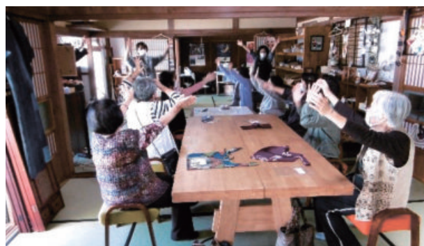
お年寄りの憩いの場「ふれあいサロン」を開催＝令和2年10月、五島市内

各地区の協議会では多種多様な事業が企画されてきました。例えば、落語やホテル鑑賞会、郷土料理を継承する行事、防災訓練などが行われてきました。その他1人暮らしの高齢者のかかりつけ病院や持病、緊急連絡先などを記載した救急キットを設置したり、買い物を支援するなど