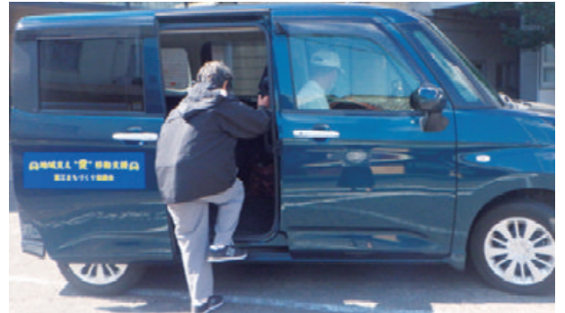
高齢者の移動支援にも注力＝令和2年10月、五島市内