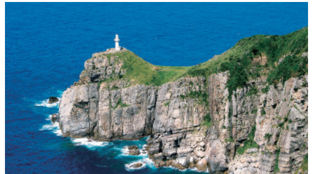
福江島最西端にある大瀬埼灯台=五島市玉之浦町