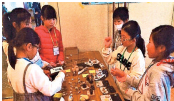
次世代を担う子どもが主体的に取り組む活動＝令和元年12月、五島市内

協議会に配分された交付金の使途も知恵が求められます。当初はイベントの景品に多く支出するなど費用対効果に疑義が生じるケースもありました。新型コロナウイルス感染症の影