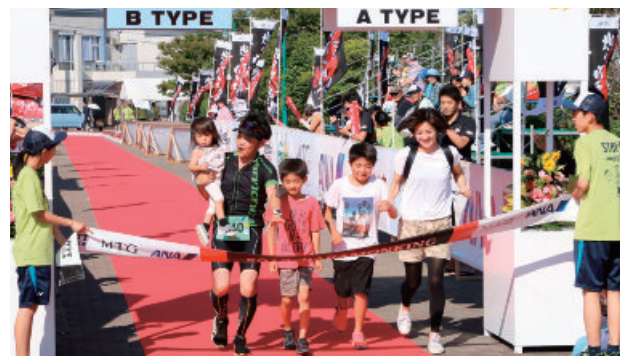
国際トライアスロン大会「バラモンキング」=令和元年6月、五島市内