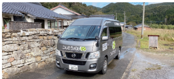
交通空白地域で運行しているこんどろバス＝令和3年10月、対馬市上県町志多留