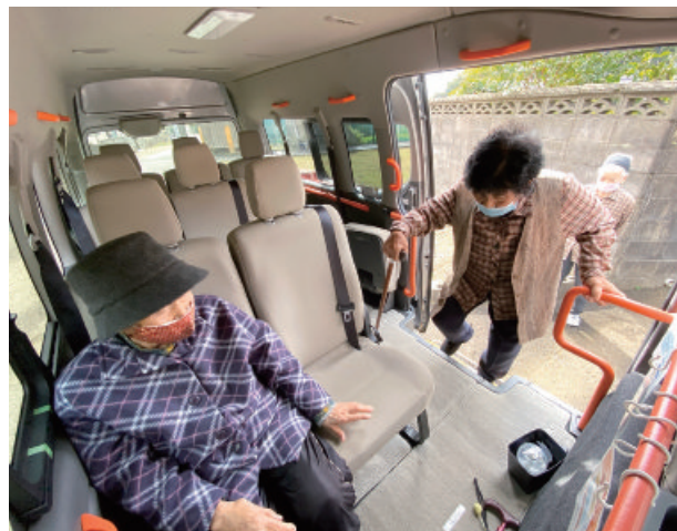
こんどろバスの車内

対馬市は、 内閣府の地方創生推進交付金を活用 して使用車両を購入しました。協議会への運行委託費として毎年230万円前後を予算化しており、 国土交通省の地域内フィーダー系統確保維持費国庫補助金も活用 して、事務局経費や車両維持費、ドライバー講習費などを賄っています。