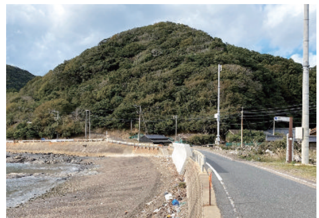
こんどろバスが通っている越高地区

協議会の事務局の仕事は、ドライバーのシフトづくりをはじめ、予約の受け付け、配車、会計、対馬市に提出する各種報告書の作成など広範囲に及びます。運行開始前から協議会の立ち上げに尽力していた市の外部 集落支援員 であった女性が、運行開始後も事務局を1人で担い、平成31年からは志多留に移住した別の女性に引き継がれ、こちらも1人でこなしていました。