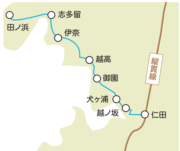
こんどろバスの主な運行エリア

る高齢者です。令和2年度は計217往復を運行しており、延べ554人が利用し、1往復あたりでは2.6人と前年度の2.2人をやや上回りました。