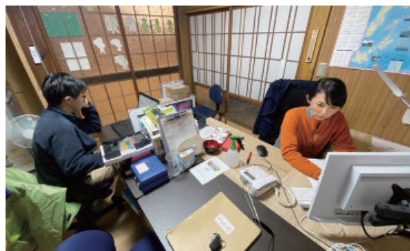
協議会の事務局のスタッフ=対馬市上県町志多留、対馬里山繋営塾

一般ドライバー5人の中には高齢者がおり、 なり手不足も課題 となっています。また、利用者は令和2年度で1往復当たり2.6人にとどまっています。利用者の掘り起こしと同時に、ドライバー確保を進めることが求められます。