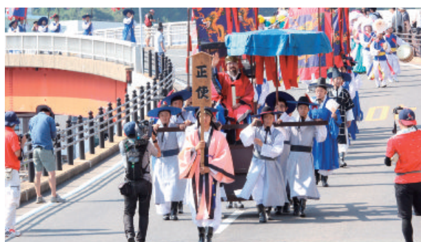
江戸時代に朝鮮王朝が日本に送った外交使節団「朝鮮通信使」の行列を再現する日韓交流イベント＝令和元年8月、対馬市厳原町