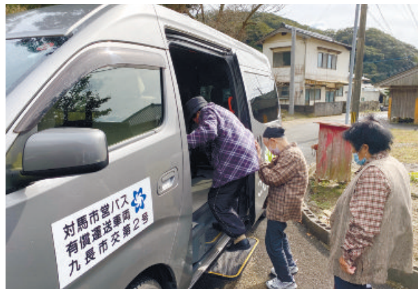
こんどろバスに乗り込む利用者＝令和3年10月、対馬市上県町越高

この団体の代表理事も移住者で歴代の事務局長と親しかったことから事務局長を引き受けることになり、スタッフと共に切り盛りしています。 事務局の人材・体制確保の大切さ が浮き彫りとなりました。