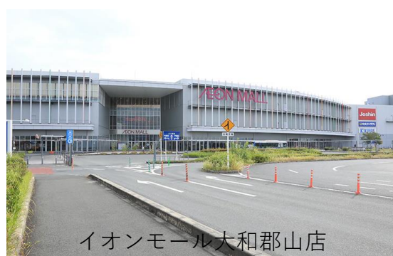
イオンモール大和郡山店

長崎カステラほか、鯖寿司、わかめ、あおさ、五島牛すきやき弁当、冷凍ちゃんぽんなど長崎の美味しいものを、ぜひご購入ください。【最寄駅】JR郡山駅