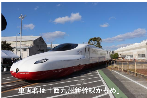
車両名は「西九州新幹線かもめ」

しかしながら、西九州新幹線の開業で、博多ー長崎の所要時間は現行の特急より約 30分 短縮され、最速で 1時間20分 になり、 乗り心地 も大きく改善されます。開業が近づき、大いに期待が高まります。