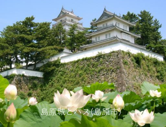
島原城とハス(島原市)