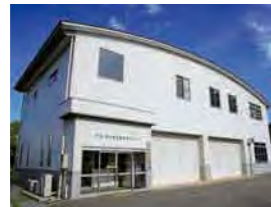
技能・技術向上支援センター

A棟1階・2階：機械加工・制御科 B棟1階・2階：電気システム科、溶接技術科、配管設備科 C棟1階：建築設計施工科 D棟1階・2階：自動車整備科、商業デザイン科 共用施設：多目的実習場