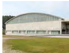
体育館 (アリーナ、放送室、ステージ)