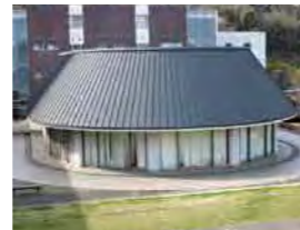
学生ホール(食堂) ※昼食は、通校生も利用可