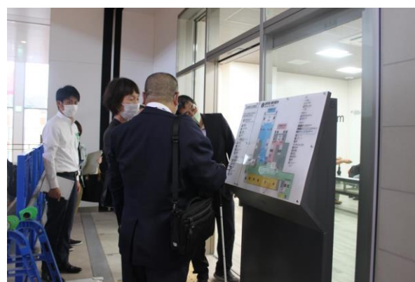
案内掲示板前での様子（諫早駅）