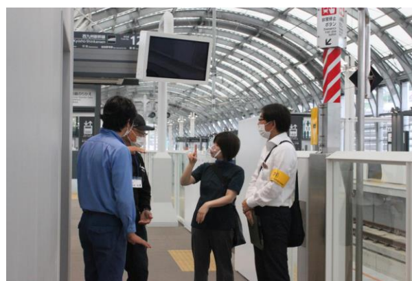
ホームでの様子（長崎駅）