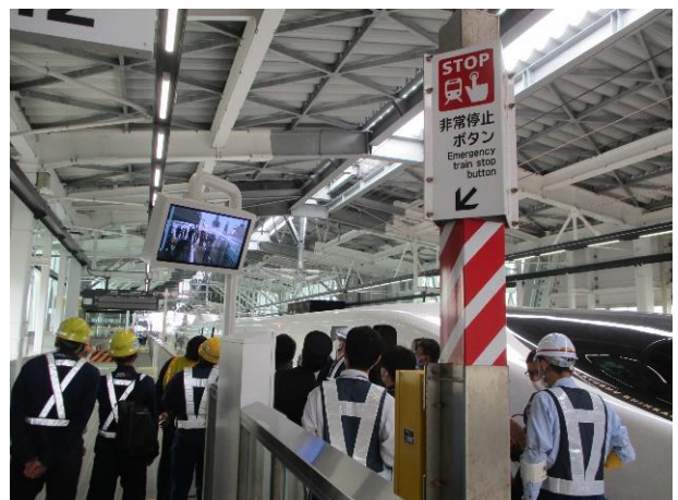
ホームを映すモニターを確認する様子（新大村駅）