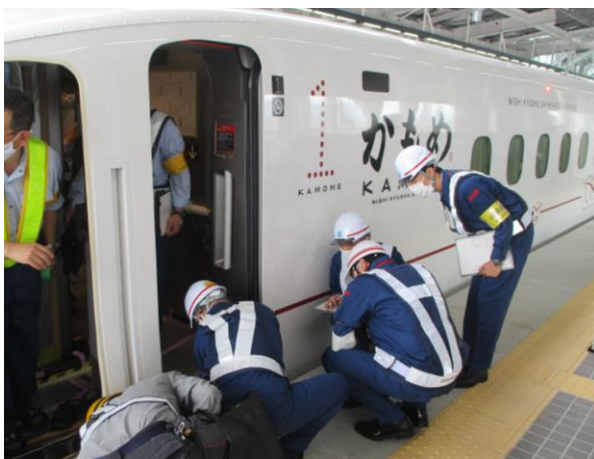
車両とホームの離隔幅を確認する様子（新大村駅）