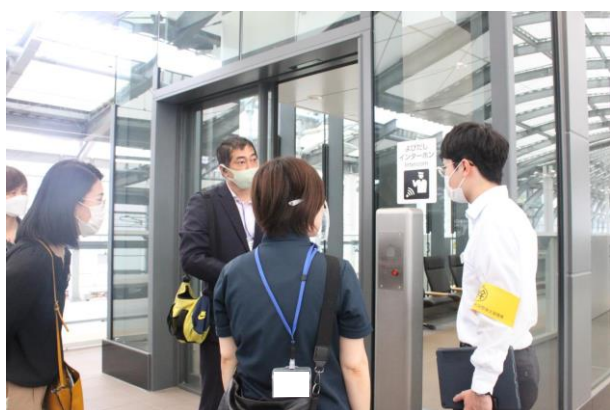
エレベーター前での様子（長崎駅）