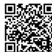
ながさきコロナ対策 飲食店認証制度