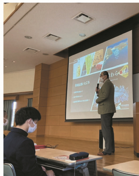
【高校生に説明する本村部長】