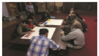
【作業に向けての打合せ】

協定農用地一筆ごと及び集落全体の将来像について、集落戦略に記入し、将来的に維持すべき農用地を明確化