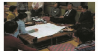
【地図を使っでの話し合い】