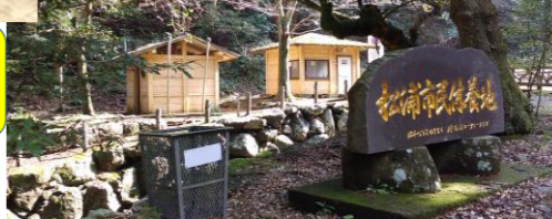
⑥ 柚木川内キャンプ場