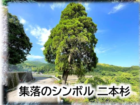
集落のシンボル 二本杉