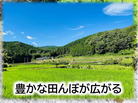
豊かな田んぼが広がる