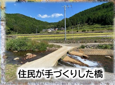
住民が手づくりした橋