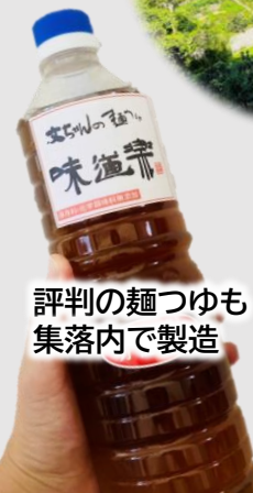
評判の麺つゆも 集落内で製造