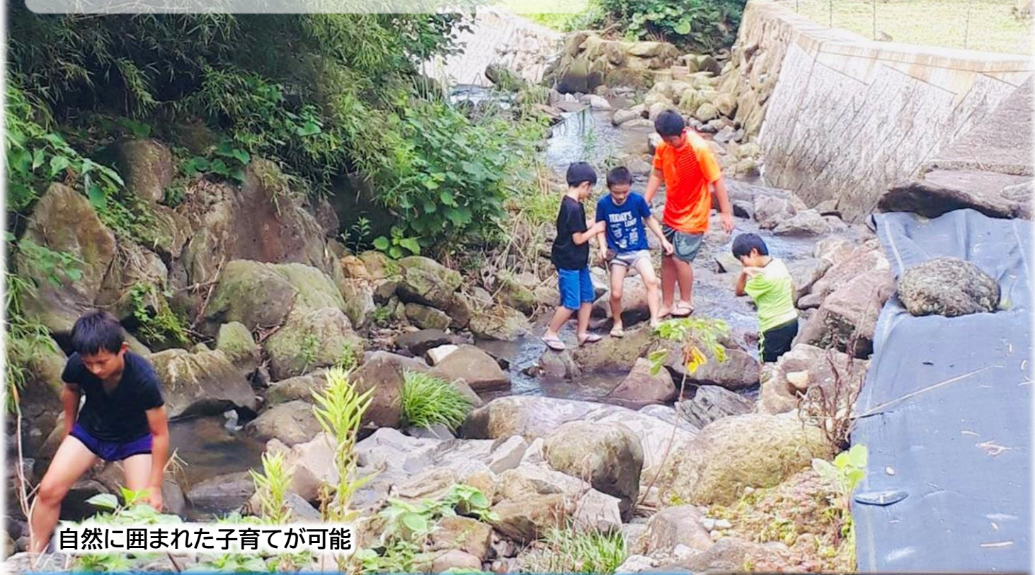
自然に囲まれた子育てが可能