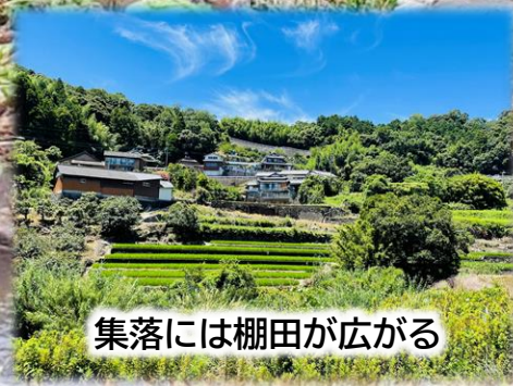
集落には棚田が広がる