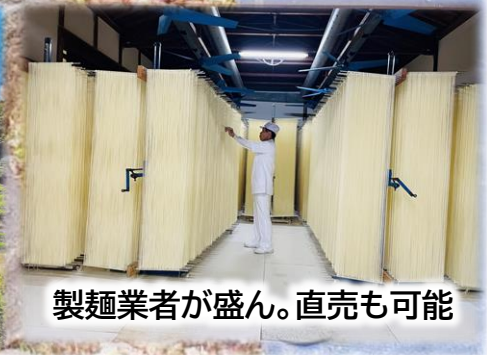
製麺業者が盛ん。直売も可能