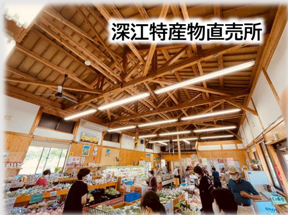
深江特産物直売所