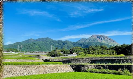
地域のシンボル 雲仙普賢岳