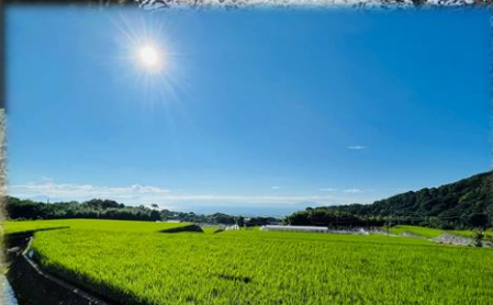
有明海を見ながら生活できる