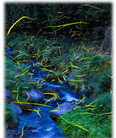
集落内に飛び交う蛍