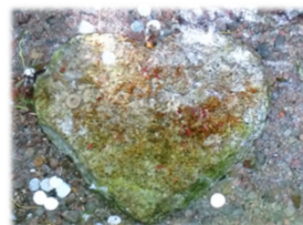
湧き水の中のハート型の石