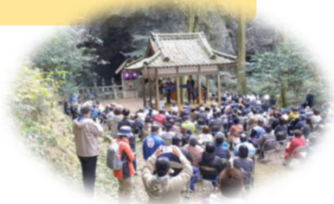
岩戸神社こもればいコンサート (R3.11.13)