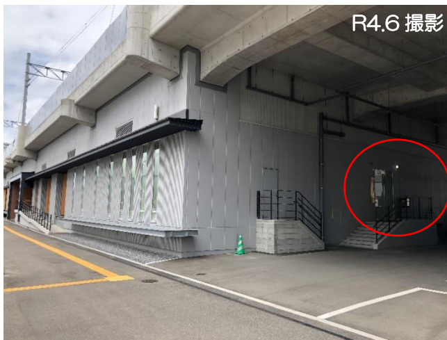
長崎総合乗務センター（全景）