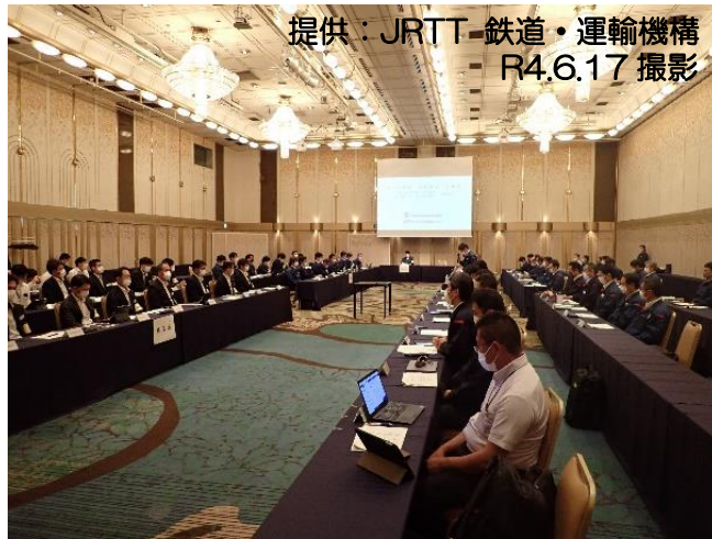
監査・検査（走行試験）の講評会の様子