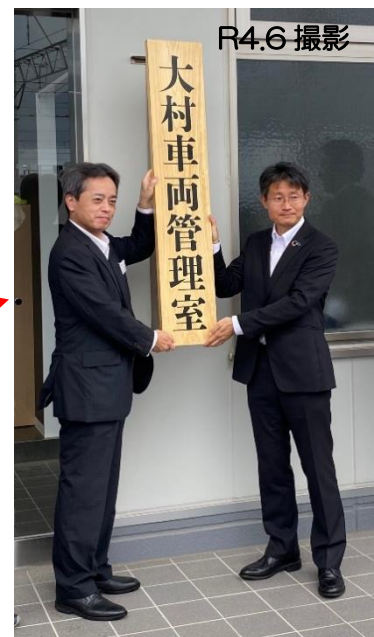
大村車両管理室の発足式にて看板を掛ける様子 （写真左）JR九州 古宮社長 （写真右）鉄道・運輸機構 九州新幹線建設局 瓜生局長