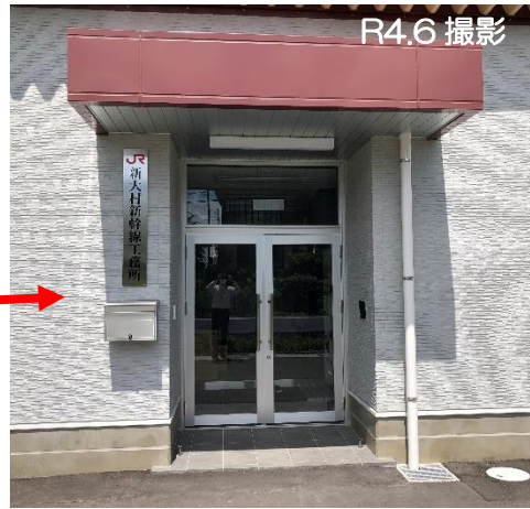
新大村新幹線工務所（出入口）