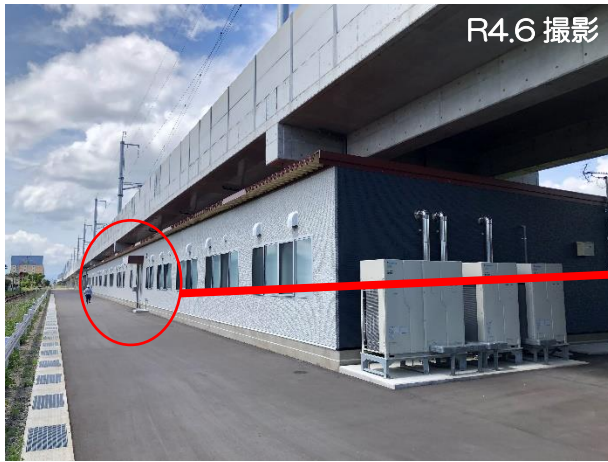
新大村新幹線工務所（全景）