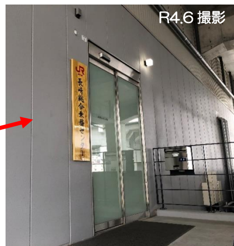
長崎総合乗務センター（出入口）