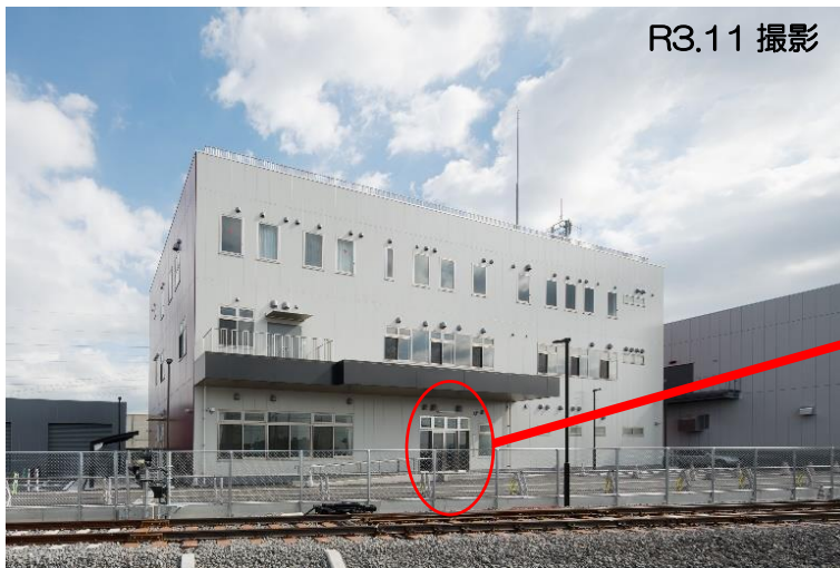
大村車両管理室（全景）