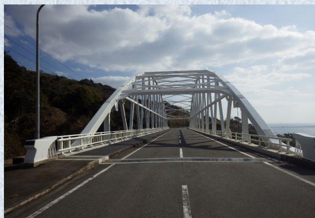
一般国道 202 号橋梁補修工事