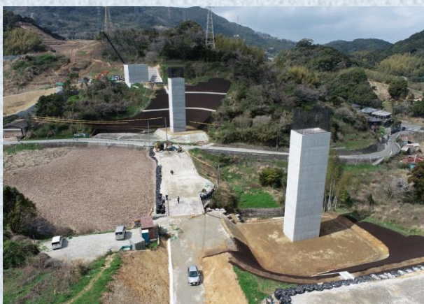
一般県道奥ノ平時津線道路改良工事