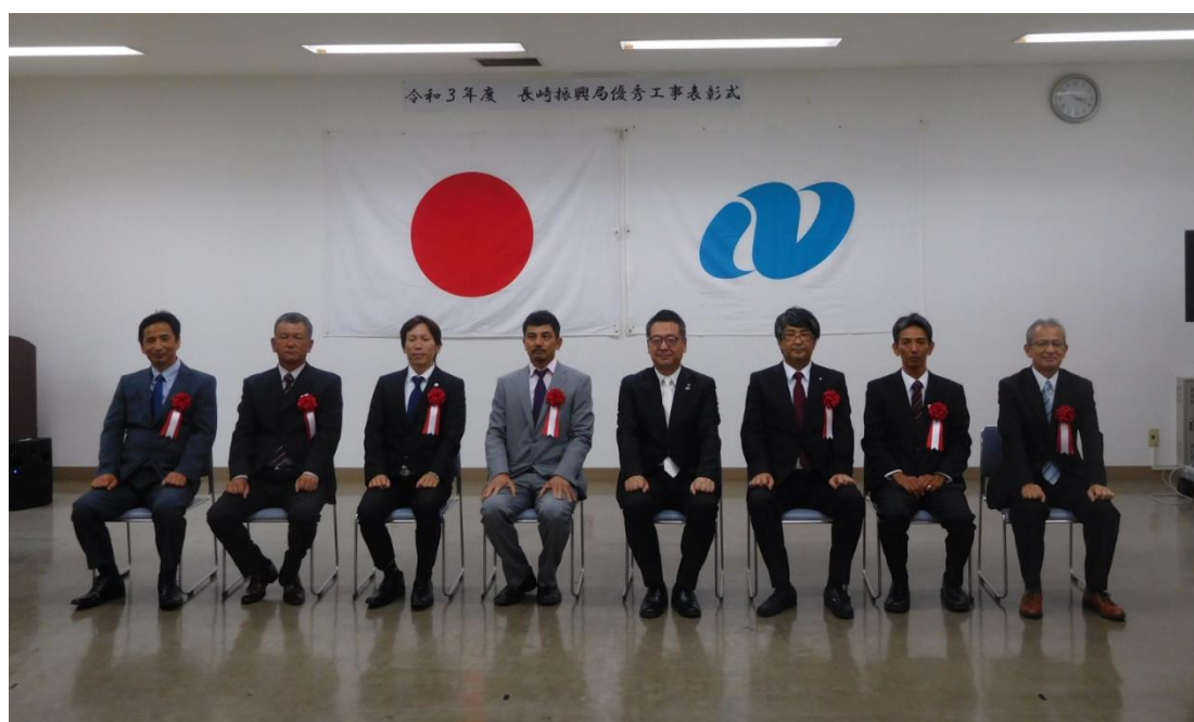
▲長崎振興局優秀工事表彰式 記念撮影