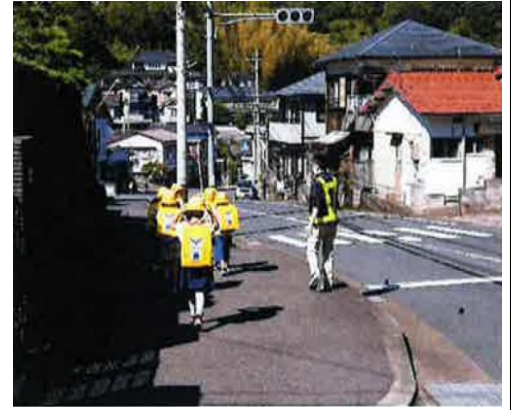
【職員による見守り活動の状況】

その後、見守り活動に従事した職員は、施設の業務用車両に「防犯パトロール実施中」とのステッカーを貼付し、愛宕小学校区内をパトロールし、地域における体感治安の向上に貢献しました。