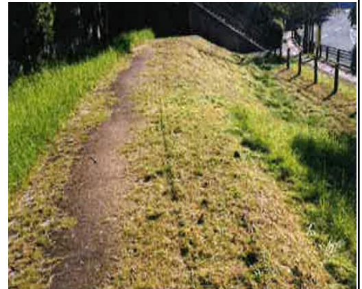
【草刈りのボランティア状況】