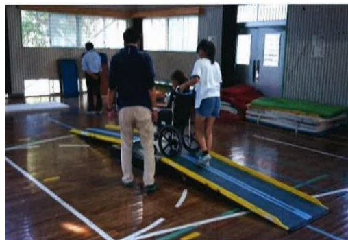
【車椅子・アイマスク体験の状況】

このような自社業務の特色を活かした社会貢献活動を通じて今後も安全・安心まちづくりへの取組をよろしくをお願いします！