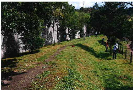
【草刈りのボランティア状況】