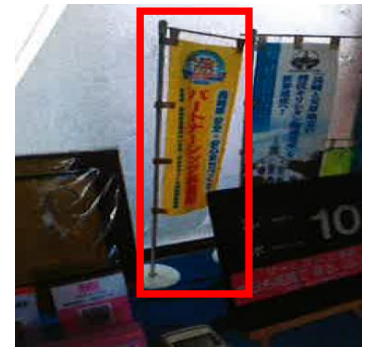
【事務所に掲示しているのぼり旗】

また、事業所の内外に長崎県犯罪のない安全・安心まちづくりパートナーシップ事業所の「のぼり旗」を掲示しているほか、全車両の後部に「シンボルマーク」を貼付しており、事業所の社会貢献活動に取り組んでいることを地域にPRするとともに、犯罪のない安全・安心まちづくりの推進に貢献しています。