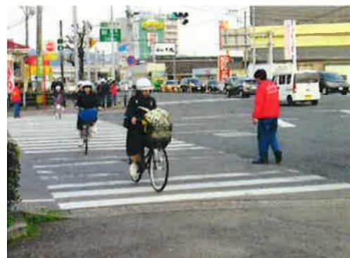
【交通誘導活動を行う従業員】

この街頭活動に従事した従業員は、大型トラック、トレーラー等の乗務員であり、交通誘導を行うことで歩行者目線でのヒヤリ・ハットを知ることができたので、従業員の交通安全意識の醸成も図ることができました。