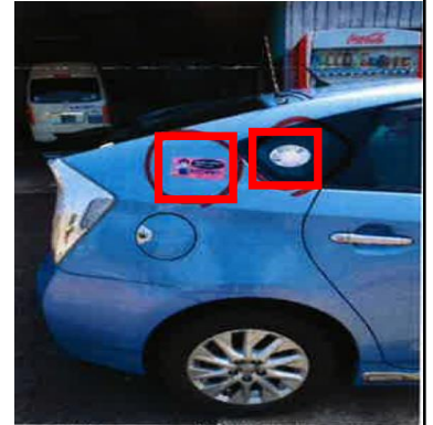
【防犯等ステッカーの貼付状況】