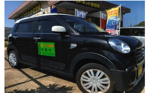
【青パト車両として運用している社用車】