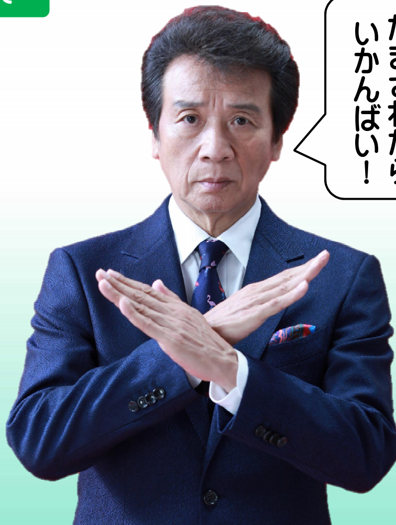
特殊詐欺等 被害防止広報大使 前川 清