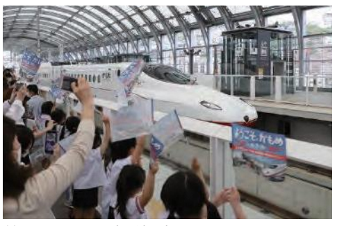
歓迎セレモニー（長崎駅）