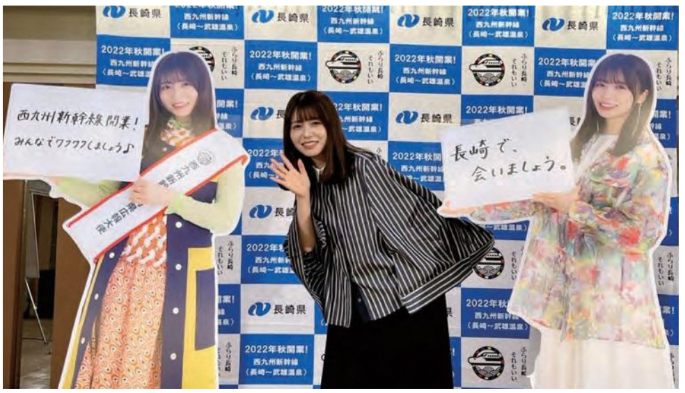
西九州新幹線長崎県広報大使の長濱ねるさん。等身大パネルは県内21市町に設置されています