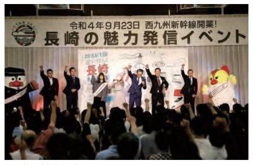
長崎の魅力発信イベント

9月23日の西九州新幹線（長崎～武雄温泉）開業に向け、県内各地で関連イベントが行われています。