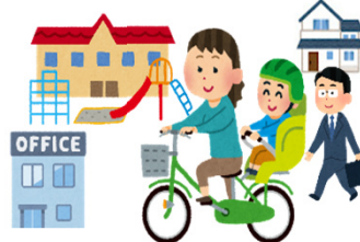
職住近接・育住近接（3世代同居・近居を含む）