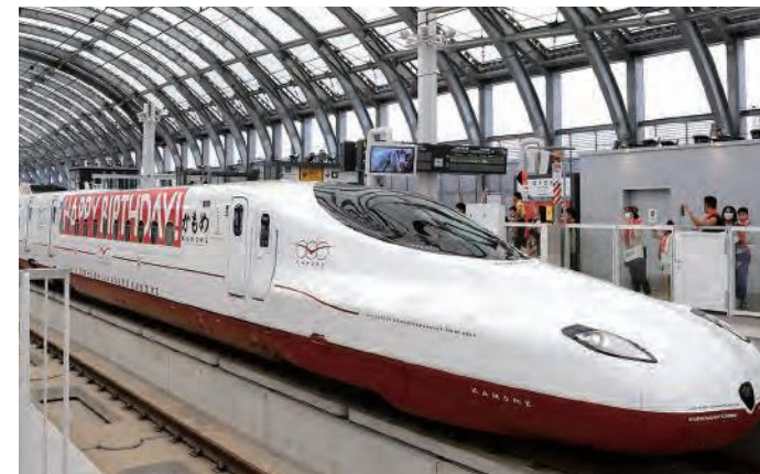
かもめフェス(P6)に登場した「かもめ」

「九州らしいオンリーワンの車両」がコンセプトで、白い車体にJR九州のイメージカラーである赤が配色されています。車内は和洋折衷で、クラシックとモダンを組み合わせた空間を表現しています。