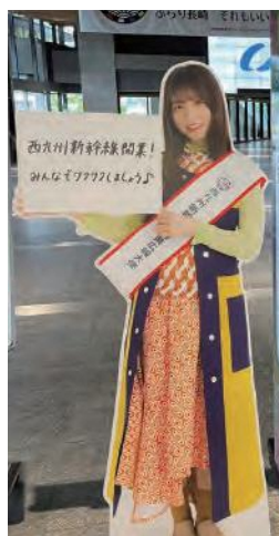
県庁エントランス