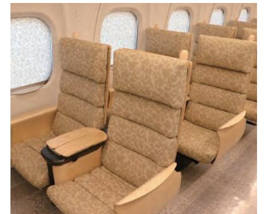
唐草をモチーフとした座席(3号車指定席)