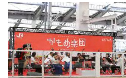
かもめ楽団の演奏の様子(長崎駅)

8月7日(日)、新幹線開業をお祝いし、県民の皆さんが参加した「かもめ楽団」による「Happy Birthday」の演奏や車内見学会が行われました。この日に撮影された開業記念スペシャルムービーをぜひご覧ください。