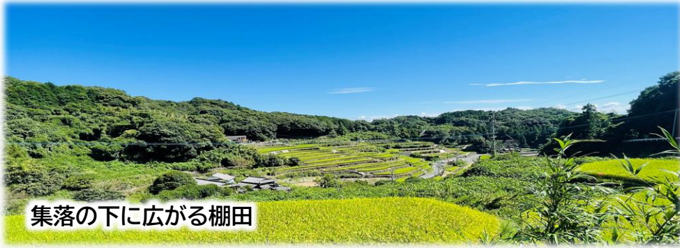
集落の下に広がる棚田