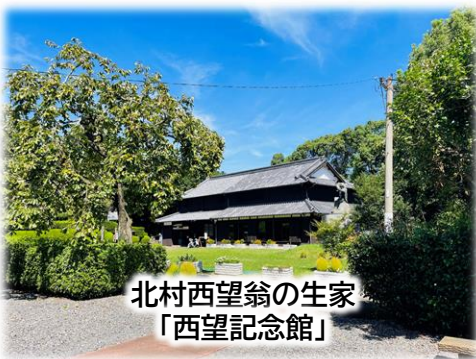
北村西望翁の生家 「西望記念館」