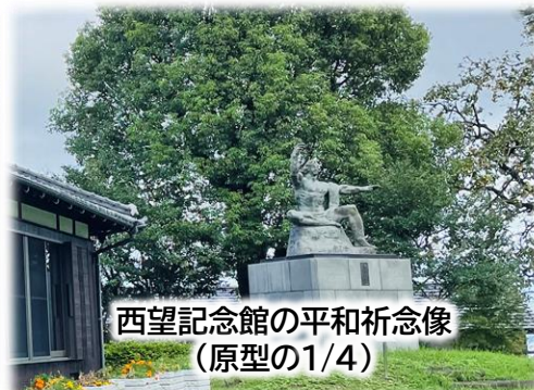
西望記念館の平和祈念像 (原型の1/4)