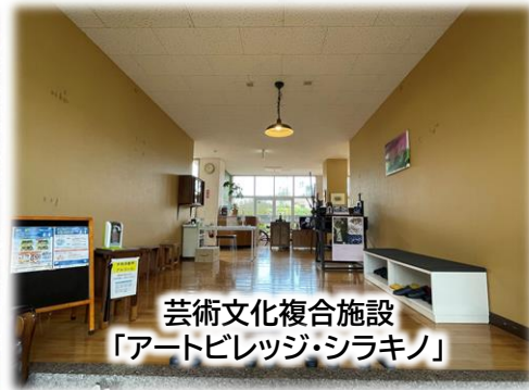
芸術文化複合施設 「アートビレッジ・シラキノ」