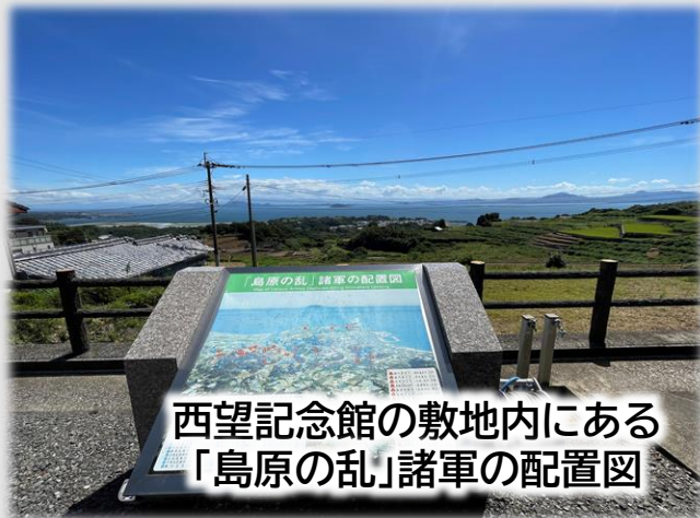
西望記念館の敷地内にある 「島原の乱」諸軍の配置図

原城跡や有明海が一望できる「西望記念館」には「島原の乱」諸軍の配置図が設置されている。ココに立って地域の歴史に思いを馳せてはいかが。