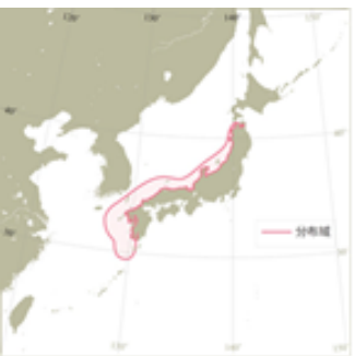
図1. 対馬暖流系群の分布域 (水産研究・教育機構より)

カタクチイワシは日本周辺に広く分布しており、このうち東シナ海から日本海側に分布する群を対馬暖流系群と称し、沿岸域から沖合域にかけて広範囲に分布していると考えられています（図1）。