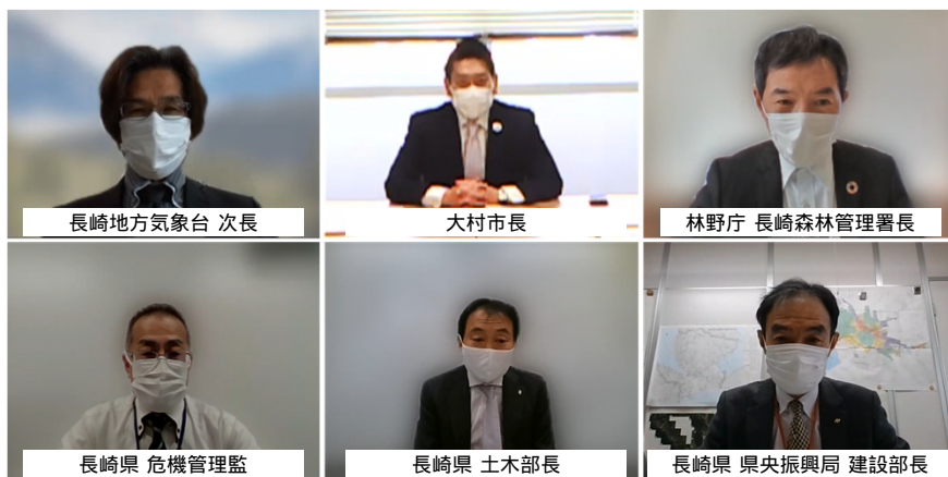
郡川水系流域治水協議会（第2回協議会）Web会議出席者