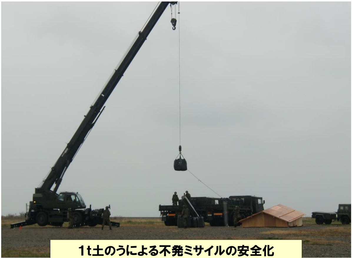
1t土のうによる不発ミサイルの安全化