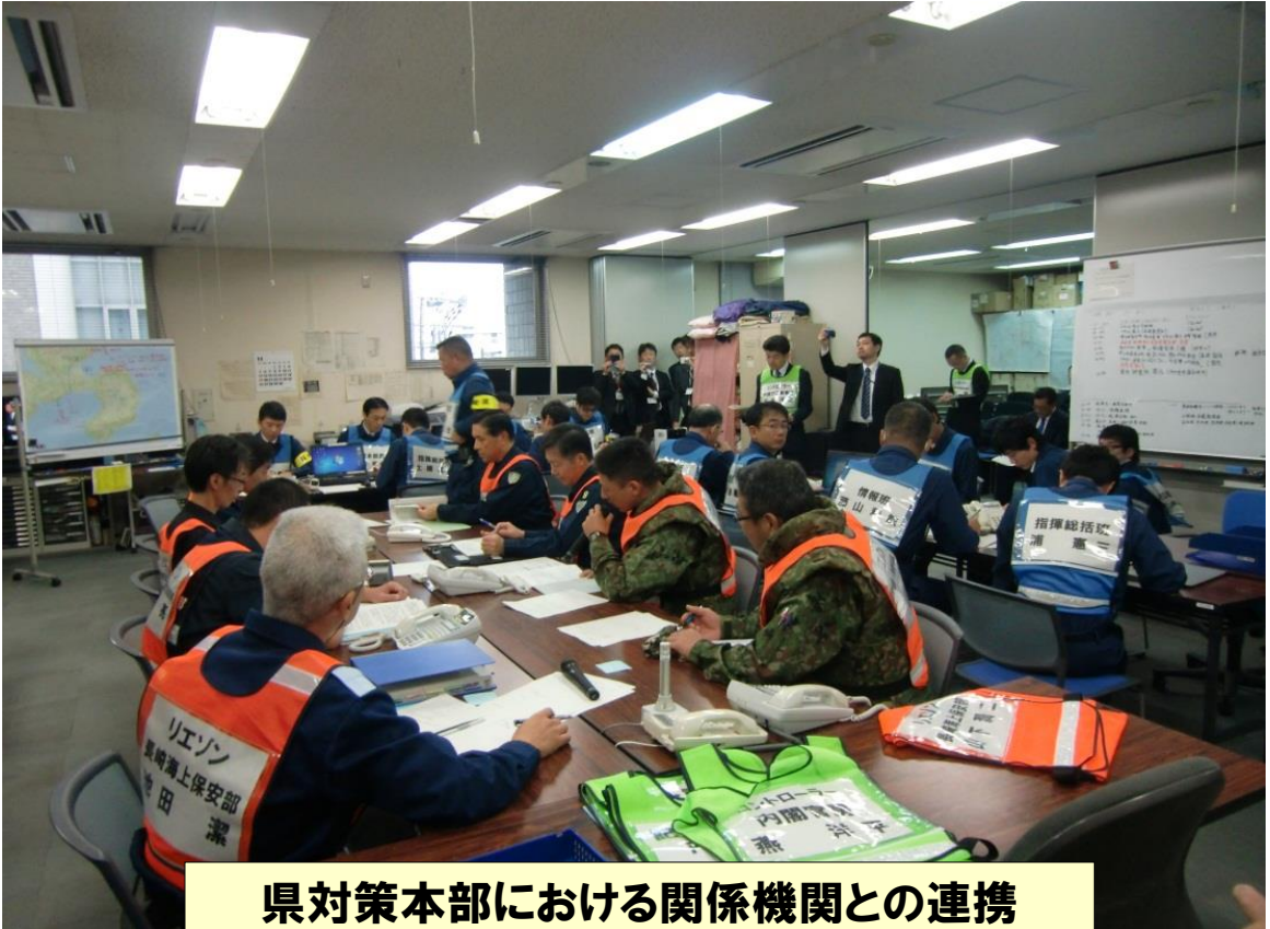
県対策本部における関係機関との連携