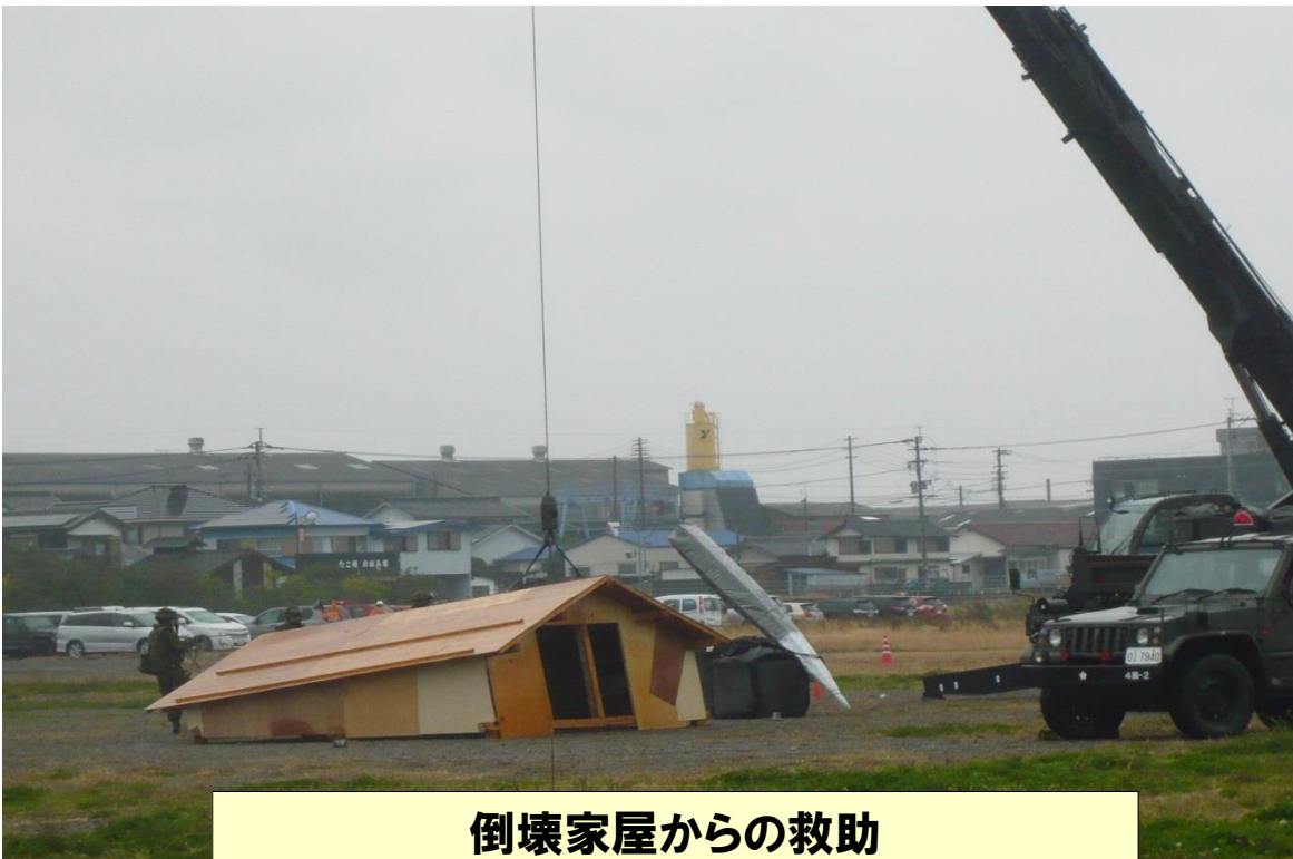
倒壊家屋からの救助