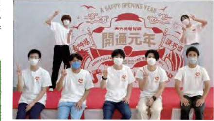
諫早ステーションフェスティバル実行委員

まちづくりや地域おこしに興味を持ったきっかけは、高校生の時に友人と一緒に取り組んだ海洋ゴミ問題の啓発活動です。当時まだ珍しかったドローンレースを取り入れたイベントを開催したところ、思った以上に反響が大きく、多くの人に海洋ゴミ問題について訴えることができました。この成功体験が自分の中で大きく、「まちづくりって楽しい」と思うようになりました。 進学で諫早市に住むことになり、早く地域に溶け込みたいとの思いから、地元のボイスカウトに入団しました。その後、大学の先輩に誘われて、市内の学生たちのコミュニティを作ることを目的とした音楽イベントや、諫早商工会議所青年部・市役所・学生たちが連携して市内3カ所で開催した西九州新幹線開業1年前記念イベント「リンク・ライクフェスティバル」の運営などにも参加しました。昨年9月の西九州新幹線開業記念イベントの一つ「諫早ステーションフェスティバル」では実行委員長を務め、演奏者の調整から当日の段取りまでさまざまな業務を担当し、責任重大で大変な役割でしたが、会場が一つになってダン