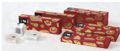
大賞の「平戸百菓繚乱」

大賞・金賞・銀賞・特別賞は県庁1階で展示しているほか、2月末までウェブサイト「e-ながさきどっとこむ」で販売しています。優れたデザインの県産品をぜひご利用ください。