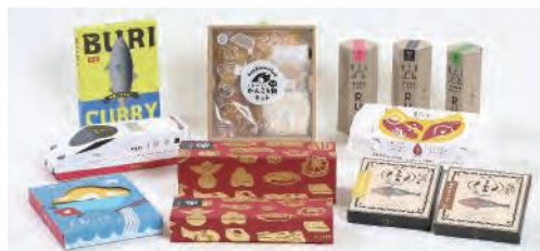
大賞・金賞・銀賞・特別賞(おみやげ賞)受賞商品