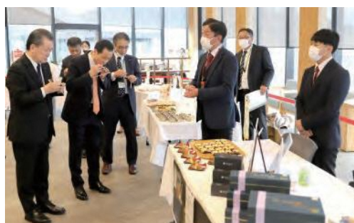
認証証書交付式での試食会の様子