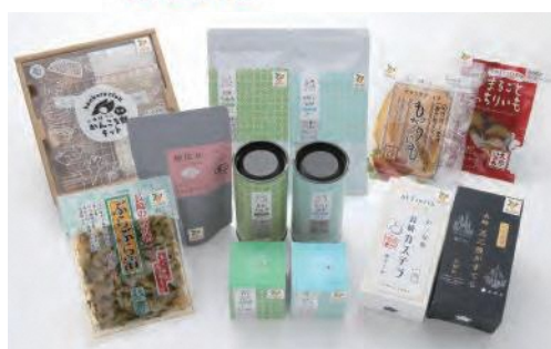
令和4年度新規認証商品

県が自信を持ってお薦めする「長崎四季畑」。大切な方への贈り物や自分へのご褒美にぜひご利用ください。認証商品の情報など、詳しくはウェブサイトをご覧ください。