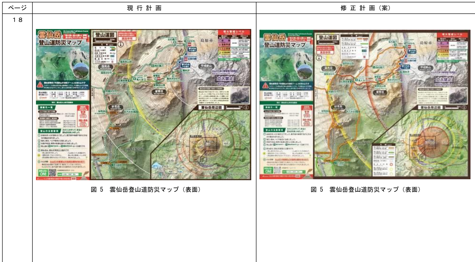
図 5 雲仙岳登山道防災マップ (表面)