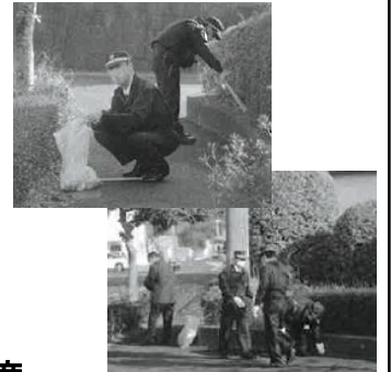
長崎総合警備株式会社 佐世保支社 長崎総合警備株式会社 佐世保支社

事業所周辺の見回りを兼ねた清掃活動を実施し、歩道や植樹帯、側溝から煙草の吸い殻やペットボトルなど様々なゴミを回収しました。 当初に比べ明らかにゴミが減少してきました。