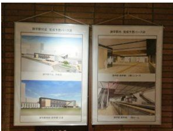
諫早駅完成予想パース図パネル