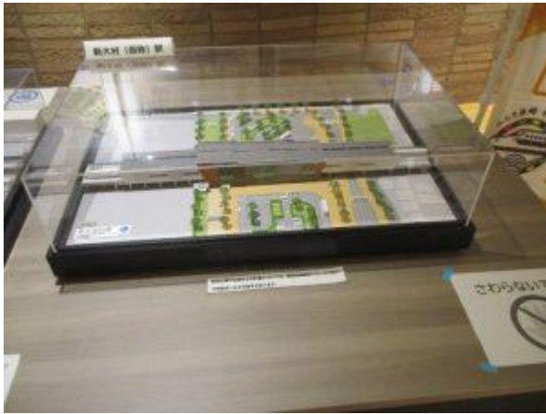
新大村駅駅舎模型