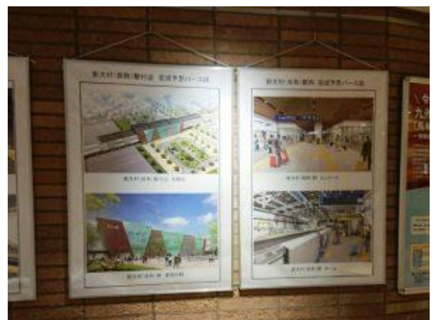
新大村駅完成予想パース図パネル