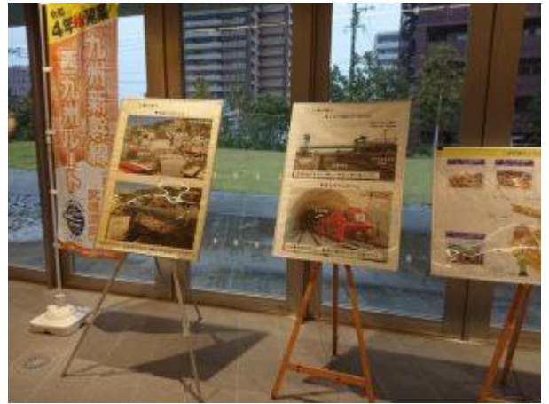
工事の様子のパネル