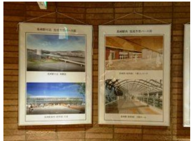
長崎駅完成予想パース図パネル