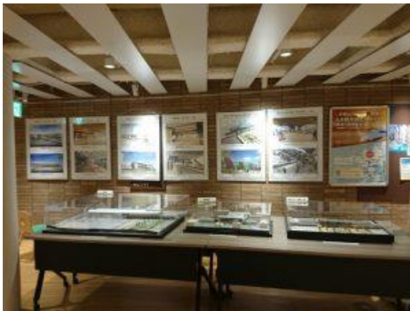
駅舎模型とパネル