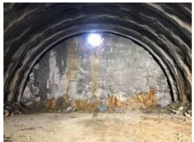
【貫通の瞬間(実貫通日 H30.4.2)】