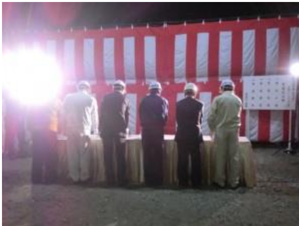
【貫通の儀(貫通発破)】