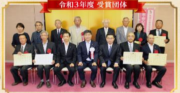
令和3年度 受賞団体