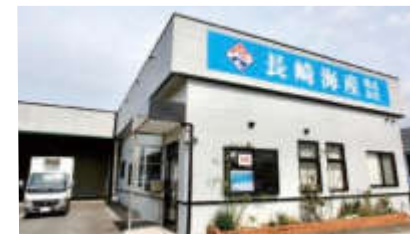
企業や工場などが多い大村市溝陸町にある 本社屋と工場

1932年に諫早市で創業したいりこ(煮干し)・かつお節・ワカメなどを取り扱う海産物メーカーで、20年前に現在の場所に移転。2019年、グループ会社との合併を機に、私が代表取締役に就任しました。取り扱いの9割は長崎県漁連から仕入れたりりこ(年間約440トン)で、約半分を全国の削り節・だしメーカー、料亭やラーメン店などの飲食店に卸し、残りを自社で加工・販売しています。