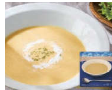
各部門の最優秀賞の中から県知事賞に選ばれた「おはようのスープ」

創意と工夫にあふれた受賞商品は、日常の生活にはもちろん贈答品にも適しているものばかりです。ぜひご利用ください。