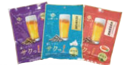
令和3年度長崎県水産製品品評会「農林水産大臣賞」、令和4年度農林水産祭「日本農林漁業振興会会長賞」受賞。味は九州醤油、明太子、ガーリックの3種類

「燻しいりこサクっ!」は、いりこを燻したことで今までにないおいしさを創出したことや、サクッと軽い新食感が高く評価され、各賞をいただいたほか、県外からもお問い合わせいただいています。現在はさらに新商品を開発中で、新しい加工場を建設することも計画しています。社員はパートも入れて35名、若い社員もいて明るく楽しい雰囲気です。これからも長崎の新鮮でおいしいいりこをたくさんの方に食べていただけるように頑張ります。