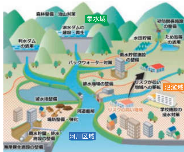
流域治水のイメージ図

県では、流域治水の取り組みを計画的に進めるため、関係者協働の場として県内各地で流域治水協議会を設置し、流域治水プロジェクトの策定・公表を進めています。