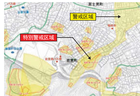
土砂災害警戒区域・土砂災害特別警戒区域の例 (長崎市土砂災害ハザードマップより)

土砂災害警戒区域 土砂災害発生時に生命または身体に危害が生じる恐れがある区域(黄色の範囲)