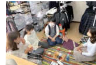
「ちっちゃなおしゃべり空間」での移住者との交流風景

20年前、夫の出身地である大村市に移住しました。自然の中で子育てをしたいと思っていたので、山と海に囲まれた大村は理想的な環境でしたし、イイダコやナマコなど大村湾の海の幸や福重地区のフルーツのおいしさにも感動しました。でも、知らない土地での生活は大変で、子どもの学校の保護者会などでも友達がいなくて寂しさを痛感しました。