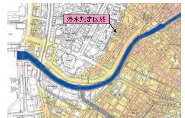
洪水浸水想定区域図の例

浸水想定区域 河川が氾濫した場合に、浸水の恐れがある区域(色付けしている範囲)。浸水した際に見込まれる水面から地面までの深さで色分けしている