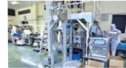
機械を使ってイリコを袋詰めする工程で、 異物混入などを人の目でもチェック