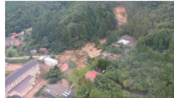
令和3年8月豪雨により発生した土石流(死者3名)【雲仙市】

近年、気候変動の影響による水災害の激甚化・頻発化が懸念されており、県では災害に備えて施設整備や防災情報の発信など、ハード・ソフト一体となった取り組みを進めています。避難情報や避難方法などを確認し、災害から身を守る備えを始めましょう。