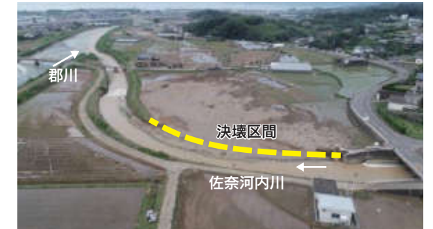
令和2年7月豪雨による佐奈河内川周辺の浸水状況【大村市】

全国各地で毎年のように災害が発生しており、長崎県では令和2年7月豪雨や令和3年8月豪雨により多くの被害が発生しました。