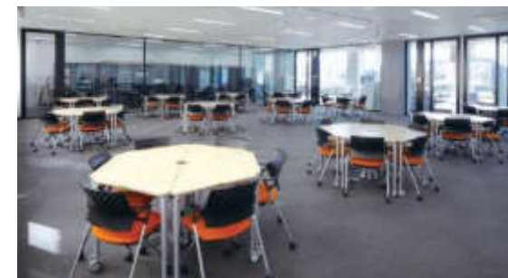
情報セキュリティ演習室