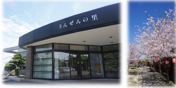
～みなさまとの出会いを大切に～