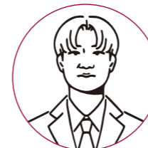
長崎明誠高等学校 出身