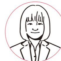
長崎商業高等学校 出身