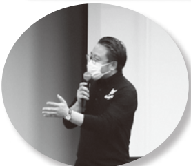
大石知事との スペシャル トーク