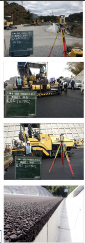
(ICT活用や舗装端部の仕上げの工夫により、走行性が向上するとともに美観に優れた舗装を構築。)