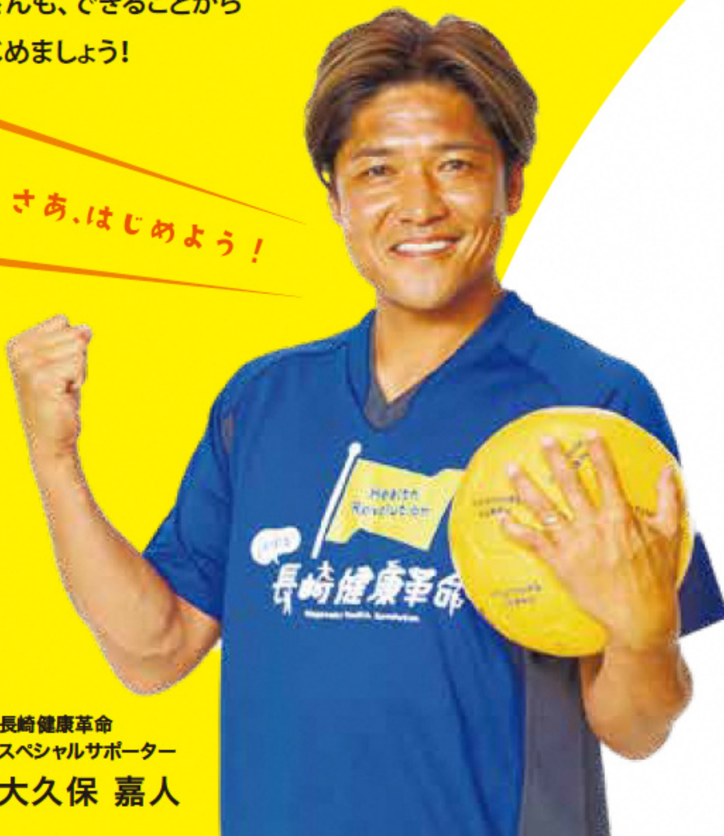
長崎健康革命 スペシャルサポーター 大久保 嘉人